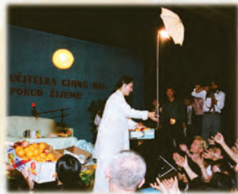
La République tchèque